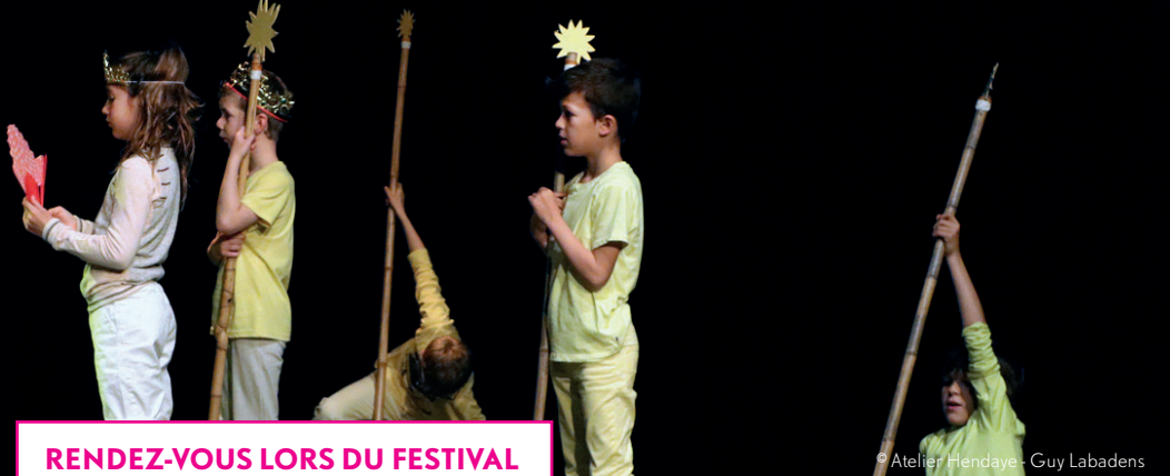
© Atelier Hendaye - Guy Labadens