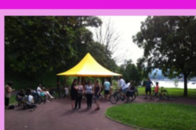
Les ateliers d'été à Belcena