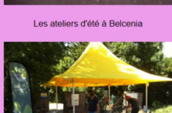
Atelier vélo au jardin botanique (St Jean)