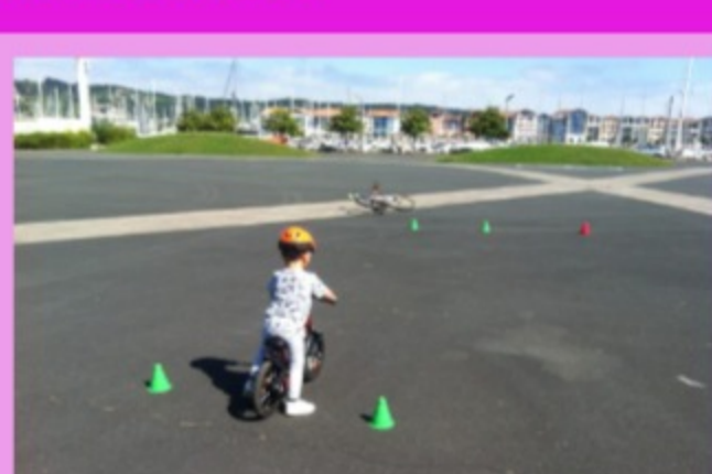
Lâcher de roulettes