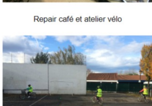
Remise en selle seniors à Hendaye