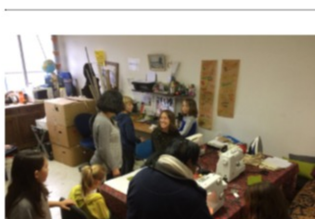
Atelier couture le mercredi