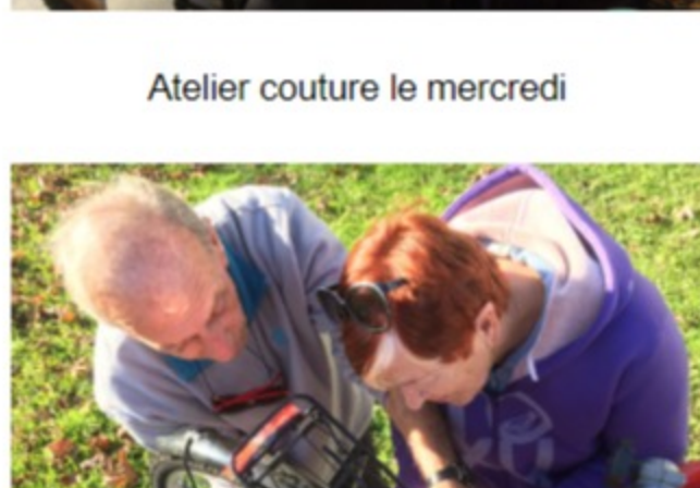
Atelier vélo seniors à St Jean de Luz