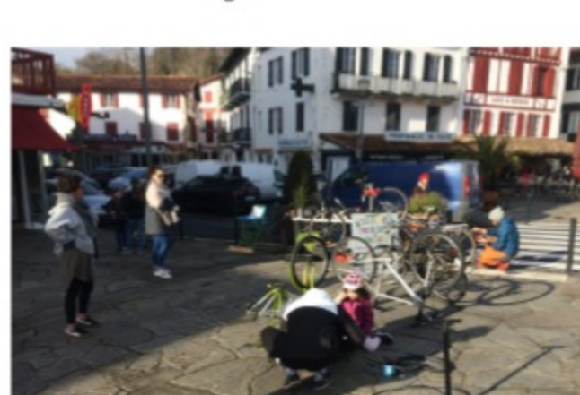
Marché de Ciboure