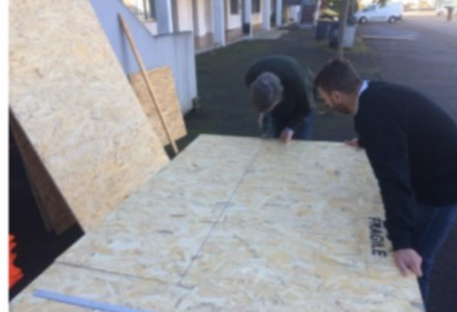
Aménagement du camion