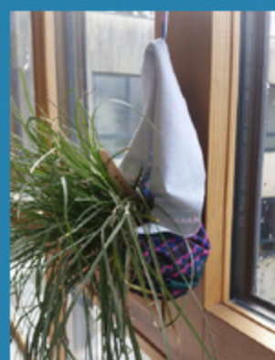
Projet de revalorisation textile des étudiants du lycée Cantau: premiers prototypes et bientôt des tutoriels