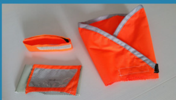
Création de prototypes pour des nouveaux ateliers Zéro déchet et couture (ici: pour rouler visible la nuit à vélo)