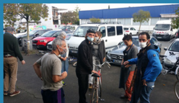
19/10 Formation mécanique pour 11 bénévoles d'ateliers vélo