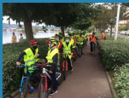
Promenade de fin de cycle vélo école avec les 5èmes de St Vincent à Hendaye