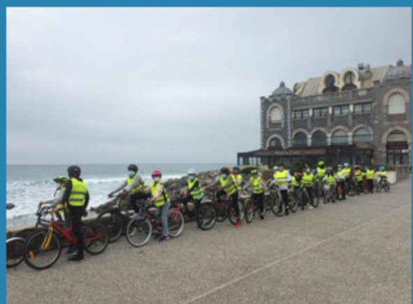
...et ensuite une belle balade