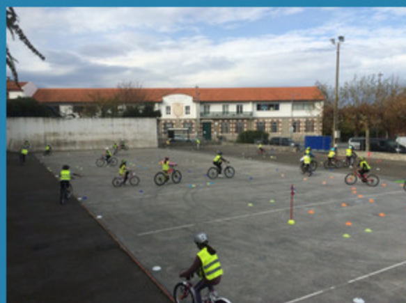
Vélo école avec 4 classes de CM de l'école St Vincent à Hendaye...