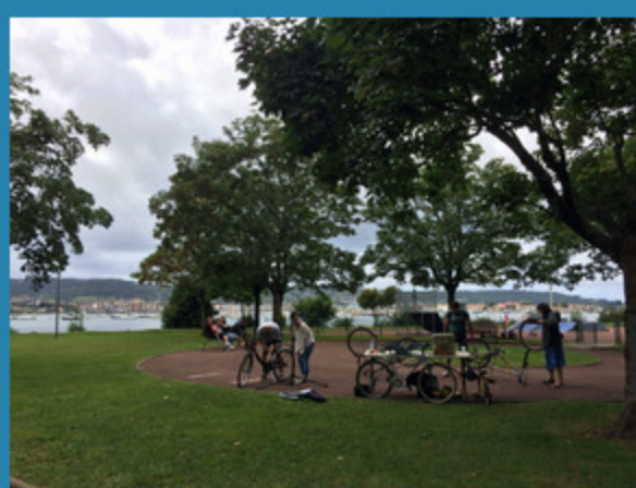
Les ateliers à Belcenia, à Hendaye...