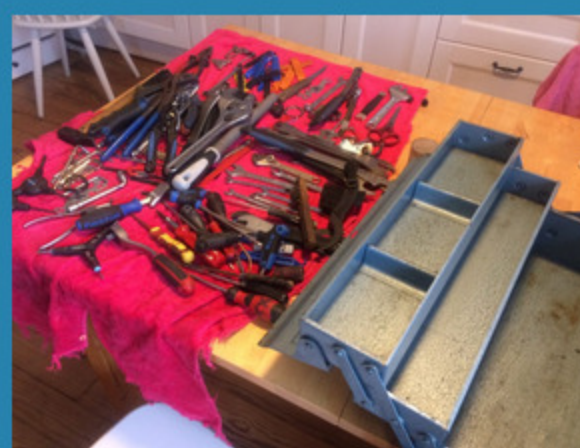
...avec séchage des outils après la pluie...