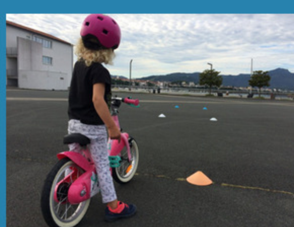
Et un lâcher de roulettes pour les plus petits !