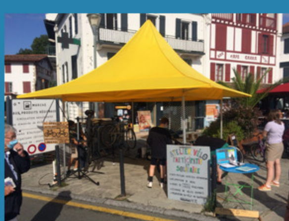
...et enfin, l'atelier mensuel au marché de Ziburu