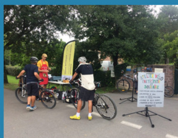
...et devant le Jardin botanique à St Jean de luz...