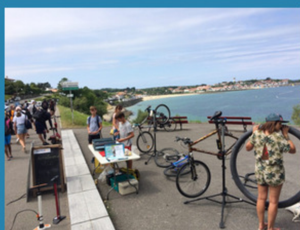
...et au carré à Socoa...