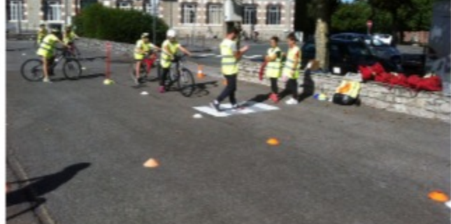
Vélo-école avec les 5e de ST Vincent