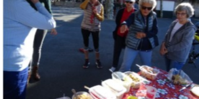
Vélo smoothie à St Jean de Luz